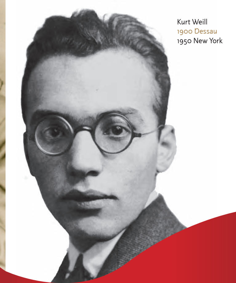
Kurt Weill 1900 Dessau 1950 New York