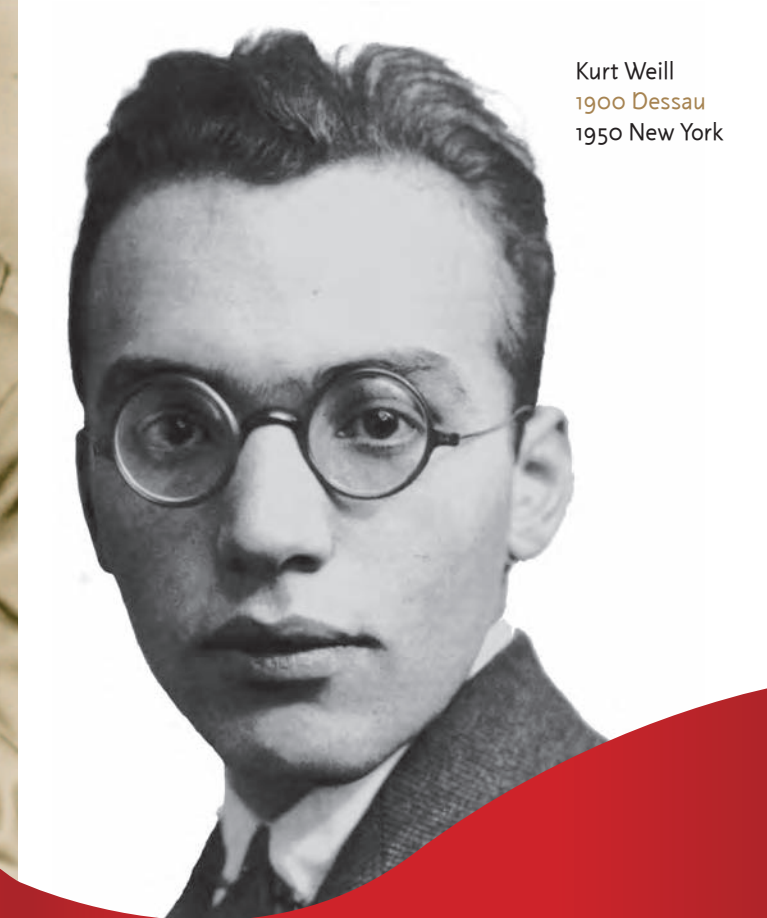
Kurt Weill 1900 Dessau 1950 New York